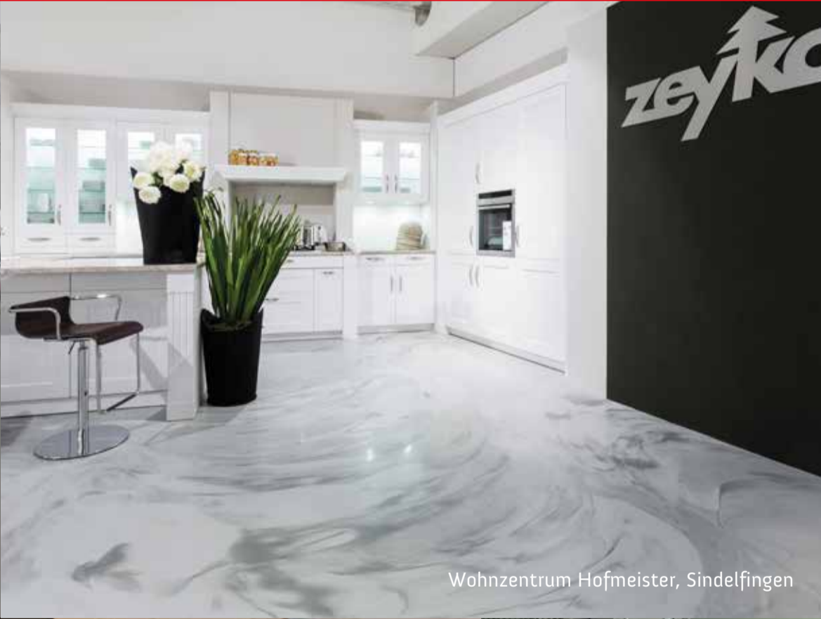
Wohnzentrum Hofmeister, Sindelfingen

Ob im Neubau oder bei der Sanierung: Arturo Bodenbeschichtungen sind vielseitig einsetzbar, nicht nur in Wohnungen, Häusern, Ladengeschäften, Gesundheitszentren, Schulen, Kindergärten oder Büros, sondern auch in Produktionsräumen und Industriehallen. Die Beschichtung ist schlag-, stoß- und verschleißfest und mit dem Stapler belastbar.