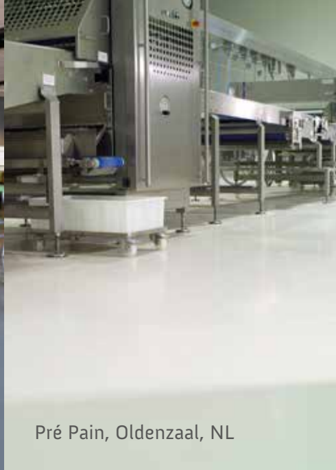
Pré Pain, Oldenzaal, NL