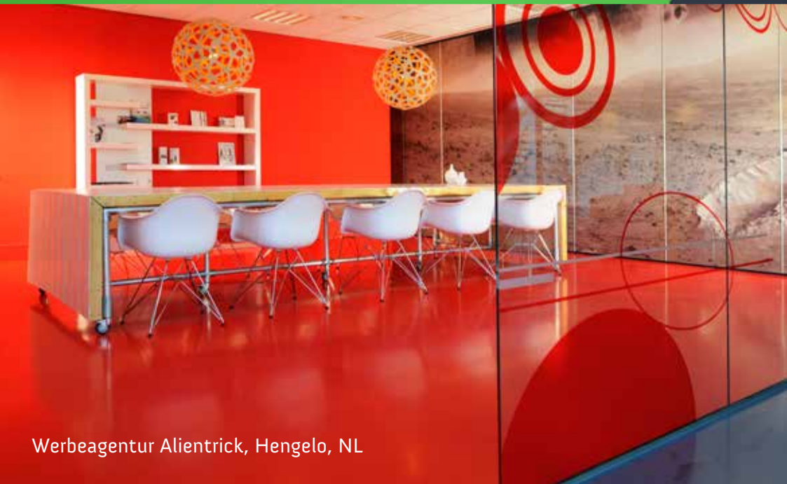
Werbeagentur Alientrick, Hengelo, NL