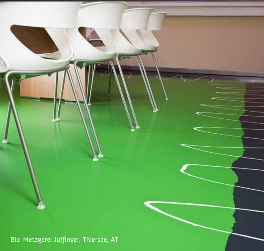
Bio-Metzgerei Juffinger, Thiersee, AT