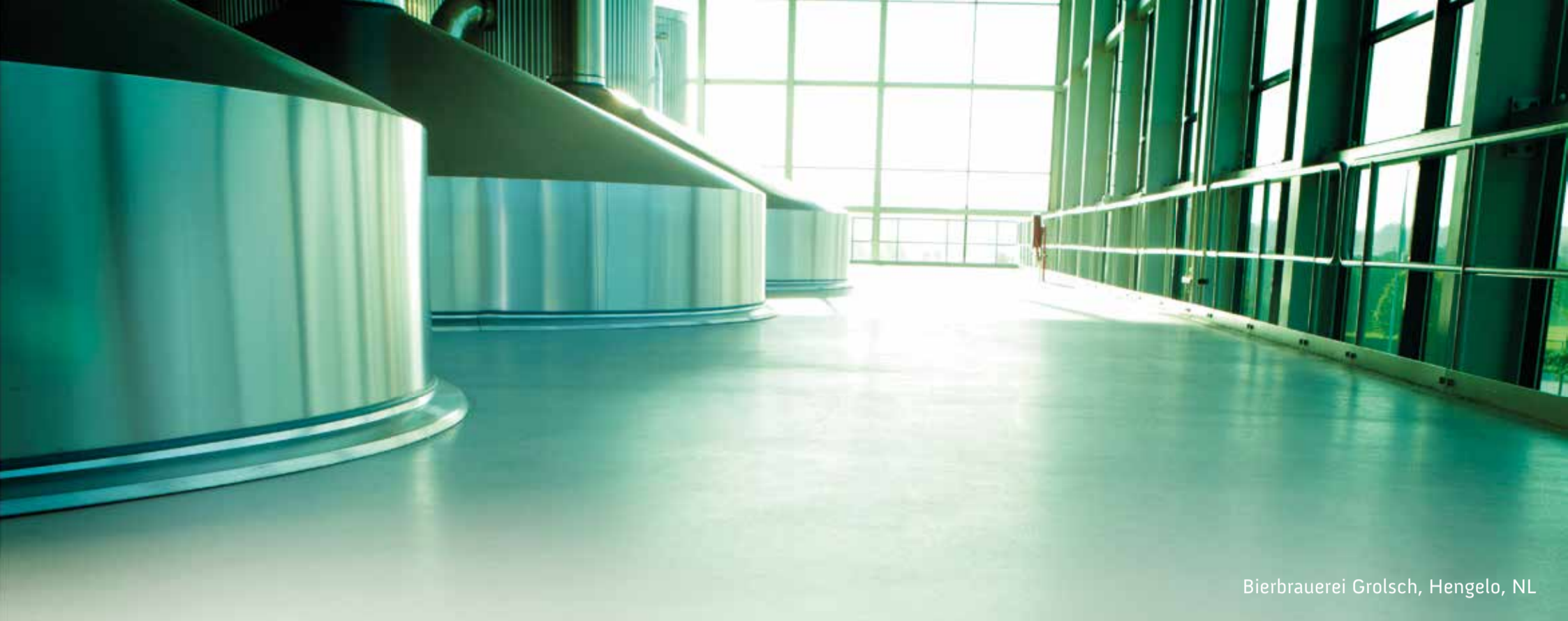
Bierbrauerei Grolsch, Hengelo, NL