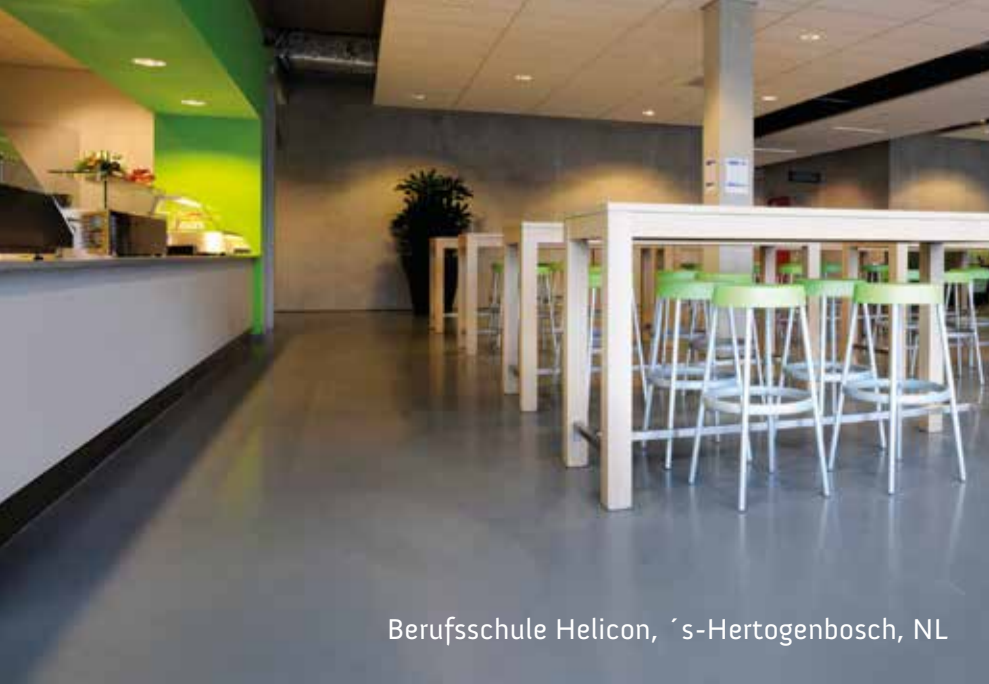
Berufsschule Helicon, 's-Hertogenbosch, NL