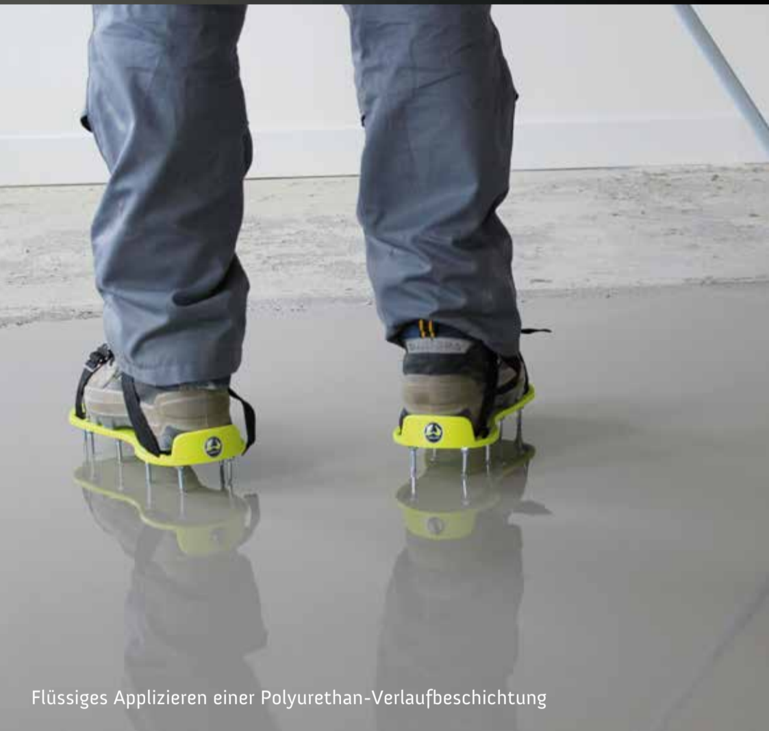
Flüssiges Applizieren einer Polyurethan-Verlaufbeschichtung