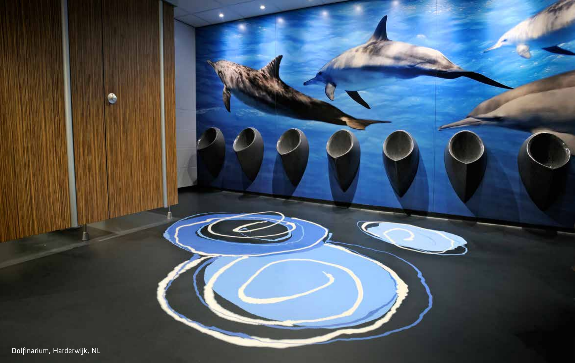
Dolfinarium, Harderwijk, NL